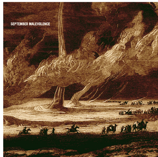
September Malevolence: After This Darkness, There's A Next (2008) 2

När jag undervisar studenter i bildanalys brukar jag rekommendera dem att spegelvända bilden: – Håll upp den framför en spegel och se vad som händer! Tanken med denna (förfrämligande) manöver är att den riktar intresset till bildens komposition