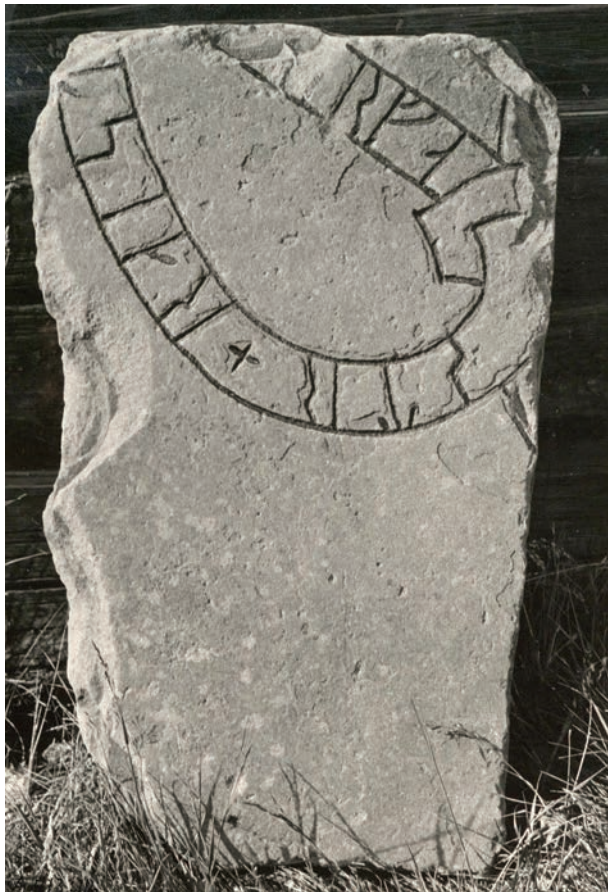
Fig. 1. Runstenen Vs 30 från Forneby, Möklinta socken, Västmanland.

Trots att Eriks produktion är ganska stor tillhör han inte de mer namnkunniga bland de uppländska runristarna. En anledning är säkert att hans ristningar är mycket homogena och att texterna är enkla och relativt korta. Ristningarna har alltid samma uppläggning: en enkel slinga som nedtill hålls ihop av en palmettförsedd bandknut. Rundjurets huvud är genomgående avbildat i fågelperspektiv och mycket snarlika kors återkommer i ristning efter ristning. De senare har alltid en smalare fot, som utgår från bandknuten. Erik har också flera karakteristiska runformer som t.ex. den smala s-runan och en ovanligt konsekvent ortografi. Att avgöra vilka ristningar som skall attribueras till denne ristare är därför inte särskilt komplicerat och de flesta av dem sammanfördes redan av Erik Brate i Svenska runristare (1925). 2 Trots detta har Stille i sin avhandling lyckats utöka samlingen, bl.a. genom att i en fotnot peka på att runstenen Vs 30 vid Forneby i Möklinta socken i Västmanland (fig. 1) måste vara