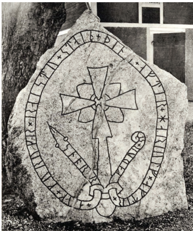
Fig. 2. Runstenen U 1156 från Hjalteberga i Simtuna socken, Uppland. Efter Upplands runinskrifter .

Egentligen borde inte utgångspunkten för en attribuering vara särskilt gynnsam i detta fall, eftersom Fornebysten utgörs av ett fragment med endast ett brottstycke av texten: ...-rfastr + raist... [ Po ]rfastr ræist[i]... »Torfast reste ...». Tittar man närmare på inskriften noterar man dock flera för Erik typiska runformer. Runan a har exem-