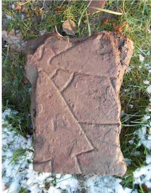
Fig. 3. Det nyfunna fragmentet av Vs 30.

Runstenen vid Forneby har varit känd länge. Den omtalas redan i Rannsakingarna 1667 och hade då sin plats på åsen vid Forneby. Av en senare inkommen relation från perioden 1682–83 framgår att det intill stenen också skall ha funnits någon form av forntida gravar. Det talas här om »små plattzer medh Steen anlagde och något lijtet förhöjde [...] som skulle i gamla tijderne varit graafplattzer». 9 Vid grävningar på åsen år 1844 påträffades också en vapenutrustning bestående av bland annat svärd, lans, sköldbuckla, yxa, pilspetsar och ett hästbetsel. 10 De märkliga fynden antas ha tillhört en förstörd ryttargrav och enligt den skrivelse som inkom till Vitterhetsakademien samma år skulle de ha gjorts »i granskapet af en Runsten, hvilken funnits på åsen vid Forneby, men vid en Byen år 1810 öfvergången brand förstörts». Att stenen skulle ha förstörts av brand är dock knappast riktigt, eftersom de mått som anges i Rannsakingarna stämmer väl överens med de måttuppgifter som Herman Hofberg meddelar 1873. 11 Däremot är det av visst intresse att Olof Grau 1754 uppger att stenen var sönderslagen i tre delar, även om han i ett tillägg i slutet av boken nämner att två av dessa »finnas nu ej igen». 12 Detta tyder på att det vid någon tidpunkt funnits flera fragment av stenen på åsen och det är inte osannolikt att det nyfunna fragmentet har varit ett av dessa. Om den plats för vapenfynden som anges i Fornminnesregistret är korrekt