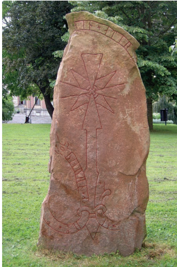
Fig. 4. Runstenen U 943 från Ärkebiskopsgården i Uppsala.

Han framhåller att detta tillsammans med valet av stenmaterial talar för att U 943 »från början har varit rest på en kristen begravningsplats, sannolikt inom det nuvarande Uppsalas område» och att U 978 kan ha haft en motsvarande placering i Gamla Uppsala (»på en kristen kyrkogård». 23