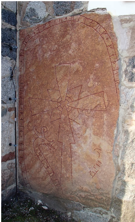
Fig. 5. Runstenen U 978 i Gamla Uppsala kyrka.

Märkligare är kanske att ingen mig veterligt (jfr dock not 21 ovan) har associerat dessa stenar med ristaren Erik. Visserligen är inte rundjurshuvudena avbildade i fågelperspektiv som man normalt finner hos denne ristare, men i stort sett alla övriga för honom typiska drag finns där. Detta blir helt uppenbart om man går igenom de olika detaljerna.